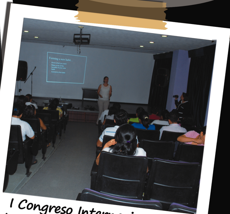
I Congreso Internacional de Investigación y Ciencias de la Educación y II Congreso Regional de Didáctica de las Ciencias